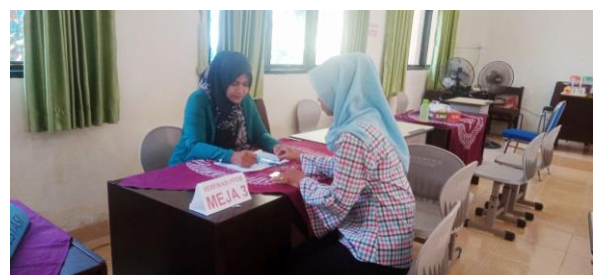
Sumber : Orang Tua Peserta Didik yang Anakinya Diterima di SMP N 40

Berdasarkan hasil penelitian tersebut pelaksanaan Peraturan Walikota nomor 26 tahun 2021 tentang Kebijakan Sistem Zonasi Seleksi Peserta Didik Baru di