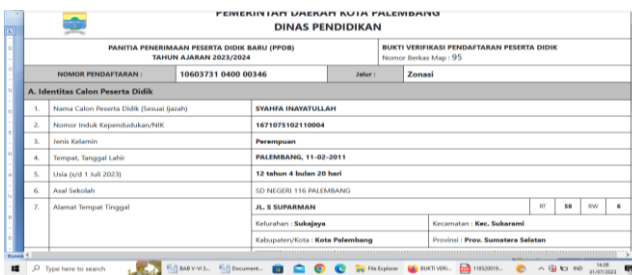
Gambar Bukti Verifikasi Pendaftaran Peserta Didik

Berdasarkan wawancara dengan kedua orang tua peserta didik yang diterima di SMP pada tanggal 17 Juni 2023 bahwa benar melakukan verifikasi ke sekolah dikarenakan verifikasi sangat penting untuk proses pendaftaran selanjutnya, dan verifikasi yang dilakukan oleh pihak sekolah yaitu melihat keaslian berkas seperti Kartu Keluarga (KK), akte kelahiran, bukti print out pendaftaran, dan cek titik koordinat untuk melihat jarak rumah peserta didik dengan sekolah untuk kelulusan pada sistem zonasi. Berikut bukti verifikasi dapat dilihat pada gambar berikut.